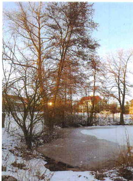
Příloha 2 – foto náletových dřevin s povolením k odstranění